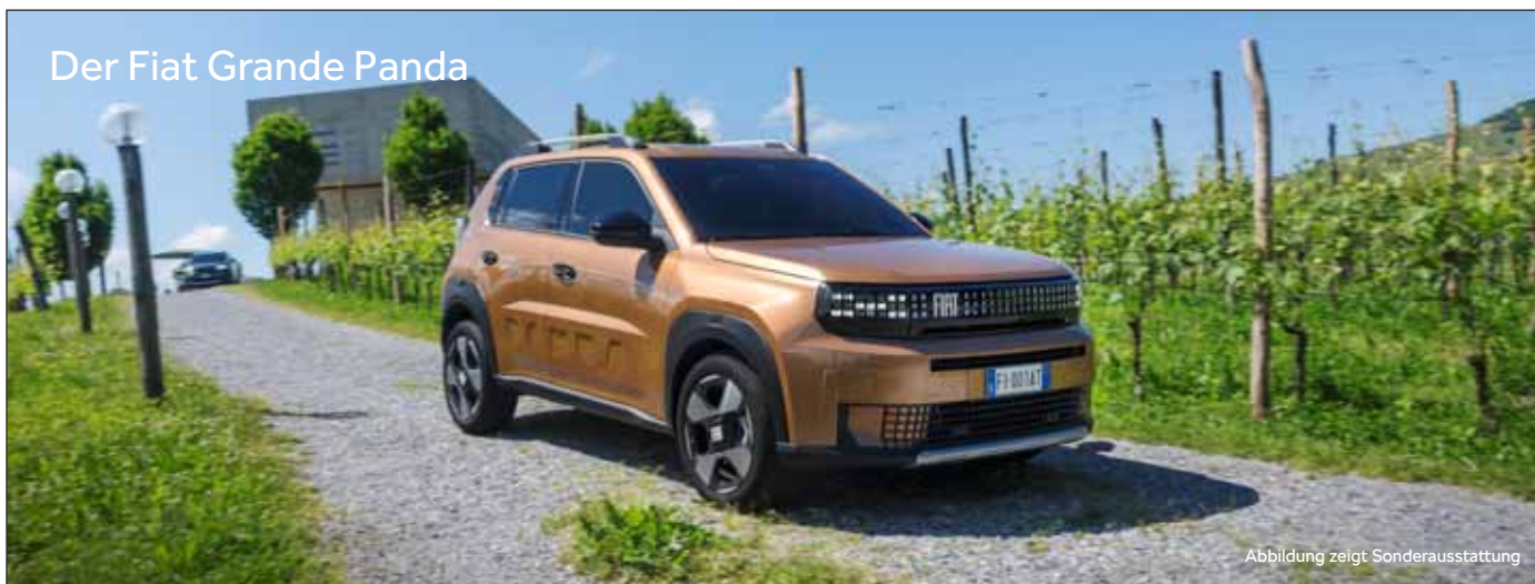
Der Fiat Grande Panda