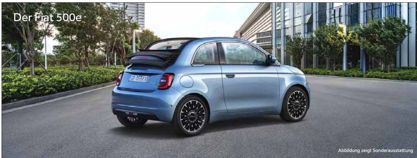
Der Fiat 500e