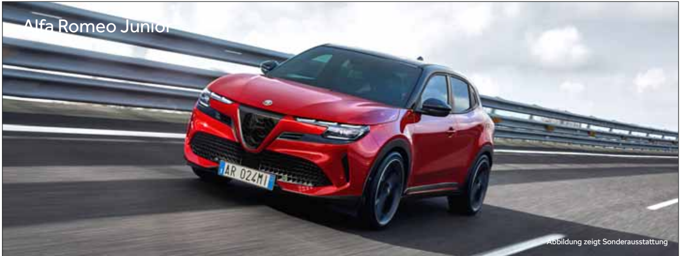
Alfa Romeo Junior