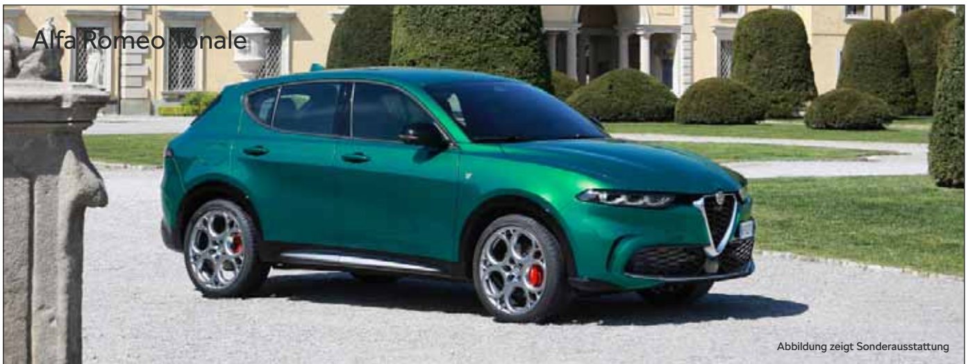
Alfa Romeo Tonale