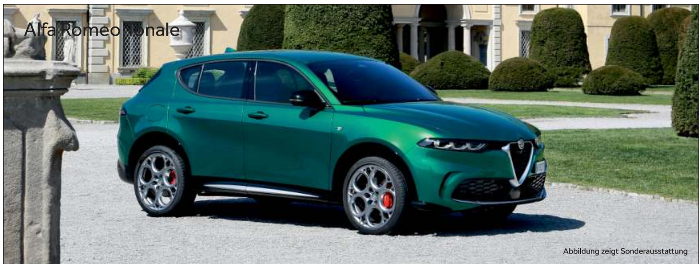
Alfa Romeo Tonale