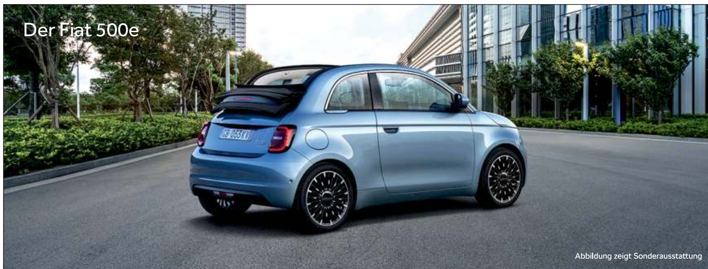
Der Fiat 500e