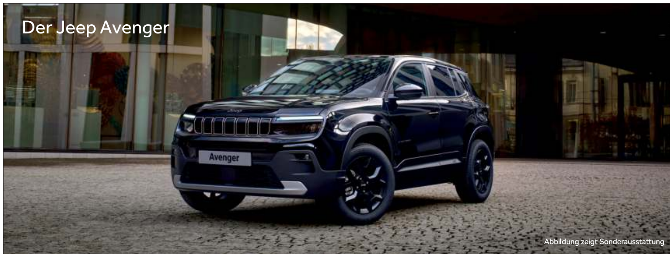
Der Jeep Avenger