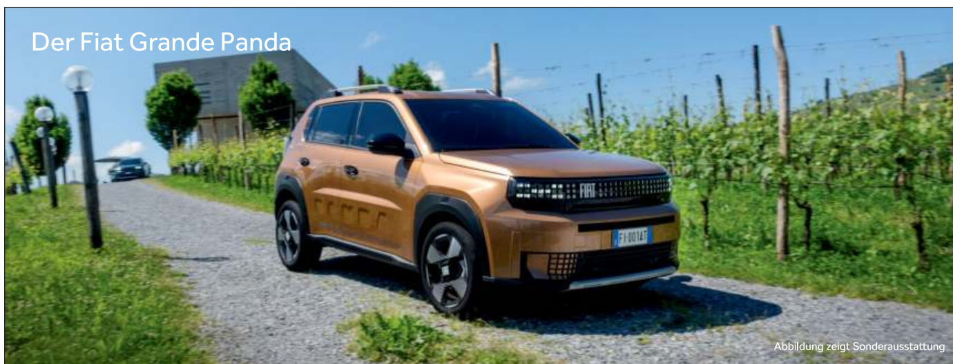
Der Fiat Grande Panda