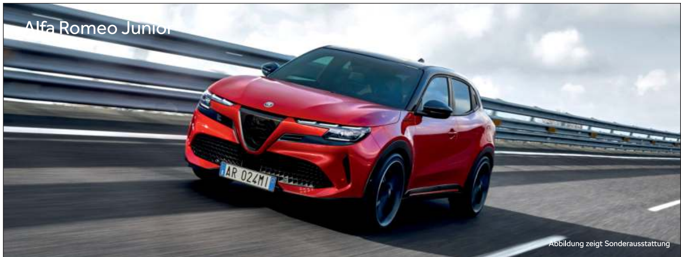
Alfa Romeo Junior