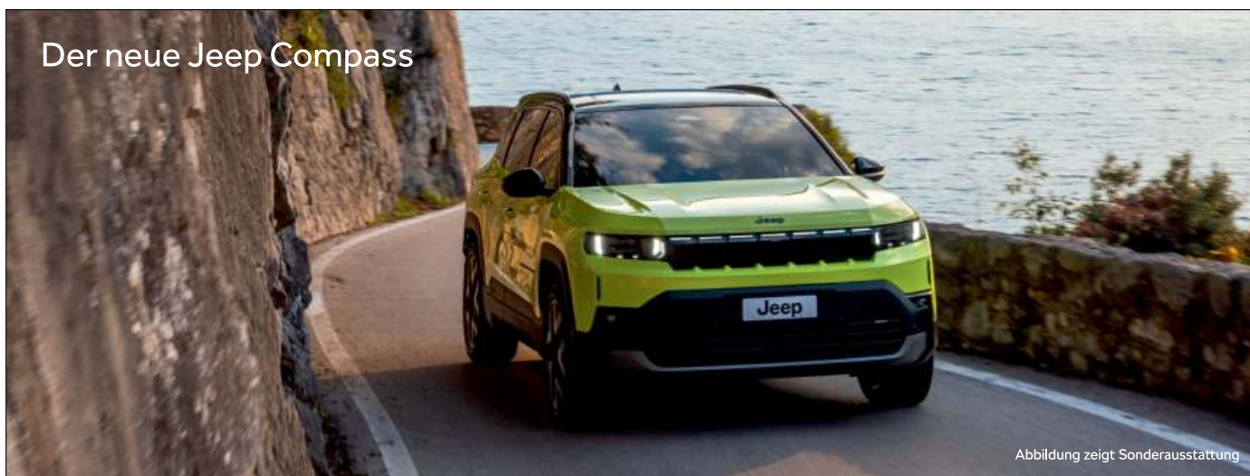
Der neue Jeep Compass