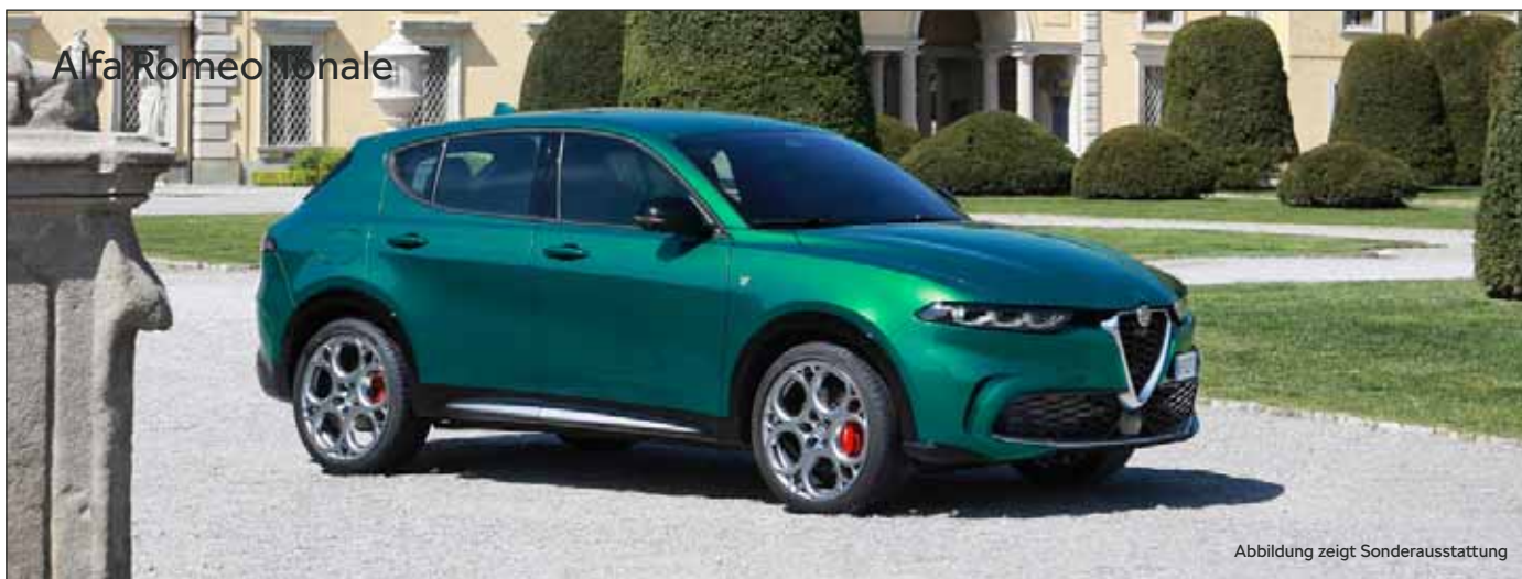
Alfa Romeo Tonale