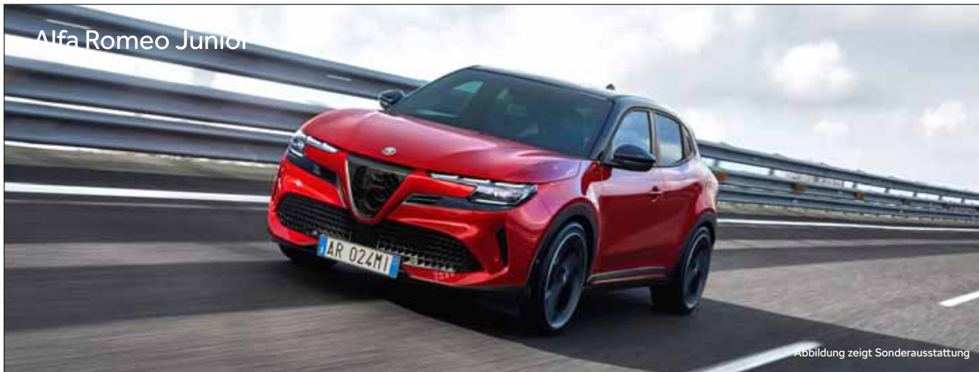
Alfa Romeo Junior